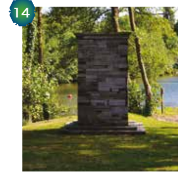
SYLVAINE & ARNAUD DE LA SABLIERE

Odile Crespy (extrait) Œuvre issue du FBV#04, 2018