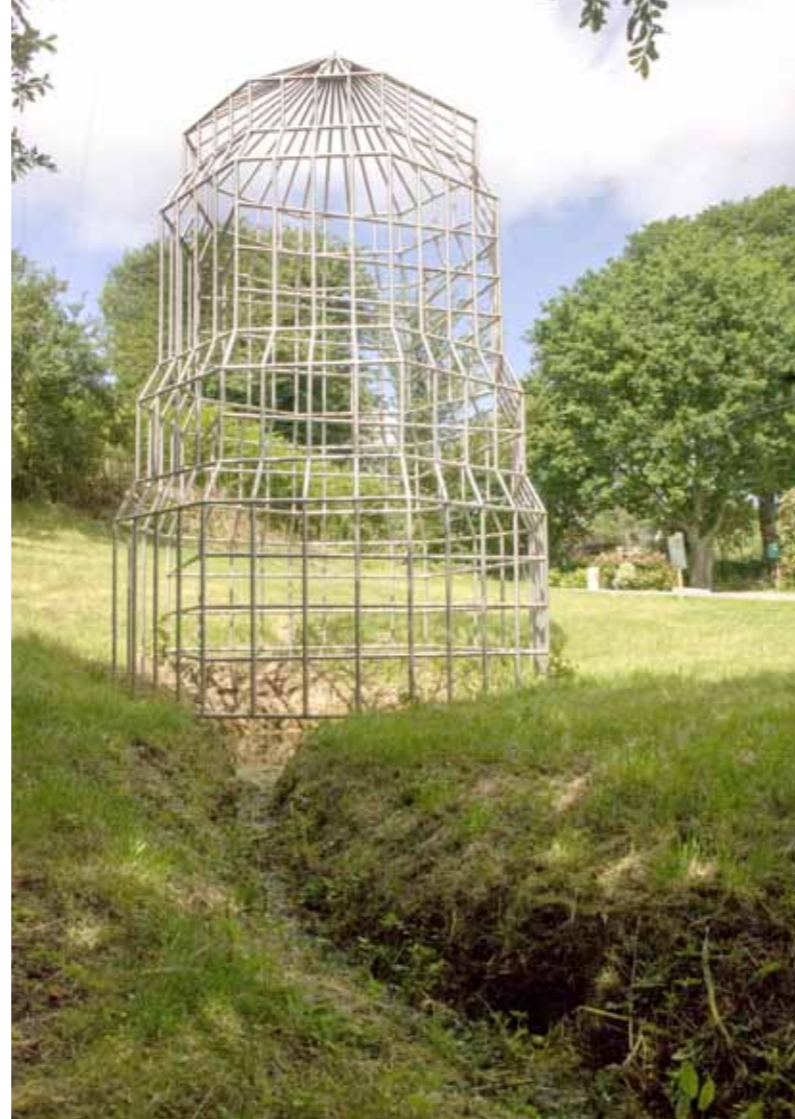
Tour de ronde , 2012 tubes en acier inoxydable commande publique pour la ville de Pont-Scroff

Nicolas DESVERRONNIÈRES né en 1988 à Nantes vit et travaille à Lorient