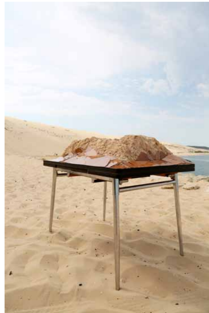
Stratigraphie , 2013 table en Formica, particules de bois, matériaux divers