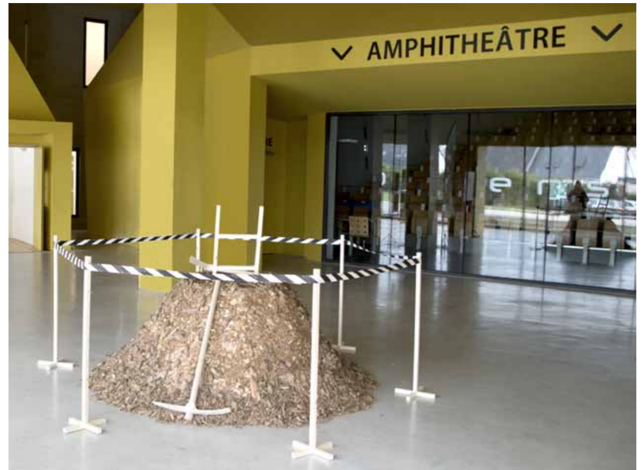
◀ Chevassuland , 2015 bois et matériaux divers Parc de Chevassu, Lorient

La curiosité, l'esprit d'observation et le goût de l'analyse, puis l'imagination et le besoin de réalisation s'exercent tour à tour, comme programmés, dans la démarche créatrice de l'artiste, et dans les domaines les plus variés. C'est ici une « carlingue » dont il donne la réplique à son modèle spatial en assemblant patiemment les lattes d'une clayette de bois : sur les traces de ceux qui l'avaient conceptualisée pour la conquête de l'espace, l'artiste, tel un passeur, en fait pour ses visiteurs le transporteur de leur imaginaire. Là, à fleur de sol, c'est une « volière » monumentale érigée en plein champ ( Tour de Ronde ) pour « signaler » la présence d'une source ou, accessoirement, en bloquer le flux, dénonçant par cette absurdité certaines pratiques du contrôle ou de l'enfermement. Ailleurs, étudiant le programme de reconstruction rapide d'un quartier de la Nouvelle-Orléans, il interprète et remodèle, à partir d'un protocole ludique, un ensemble de