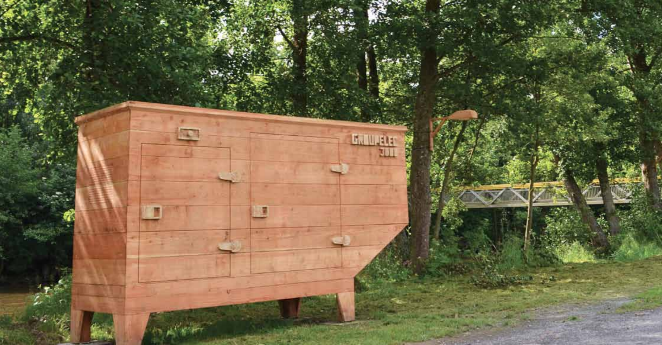
Groupelec 3000 , 2018 bois (Mélèze et Chêne) Festival des Bords de Vire - 4 e édition